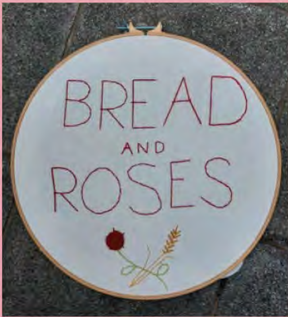
Brodwaith o stitching4change