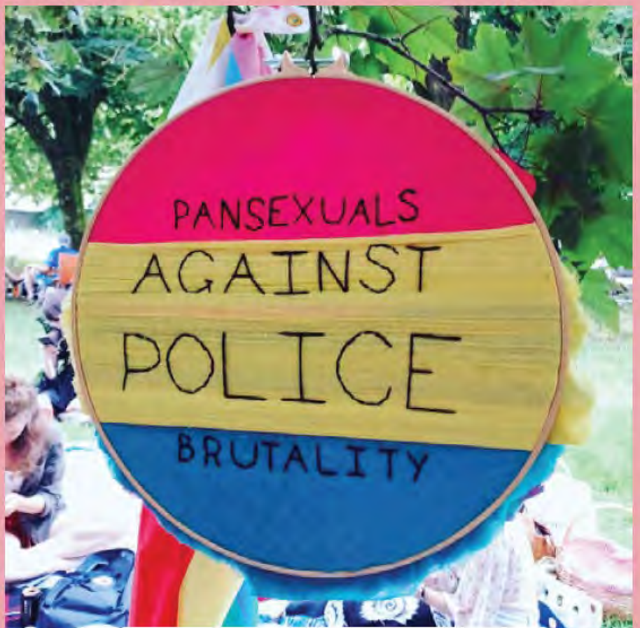
Brodwaith o stitching4change